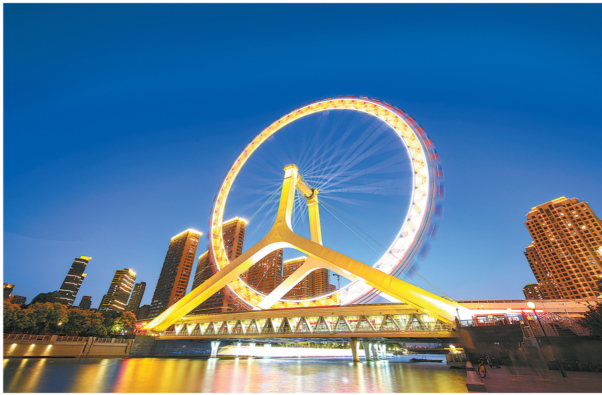
时光的眼睛

在个人学习和业务方面,更得“斤斤计较”。反思每天自己是否进行了业务学习、是否完美地完成了领导交给我们的工作。想要在工作中有一番作为,就必须把能力当成资本来经营。企业发展的核心力量是人才,个人发展的核心力量是能力。企业不能出现“人才危机”,个人不能出现“能力危机”。只有时时更新知识,永不自满加强各种能力的学习,才能提高工作中的预见性和创造性。