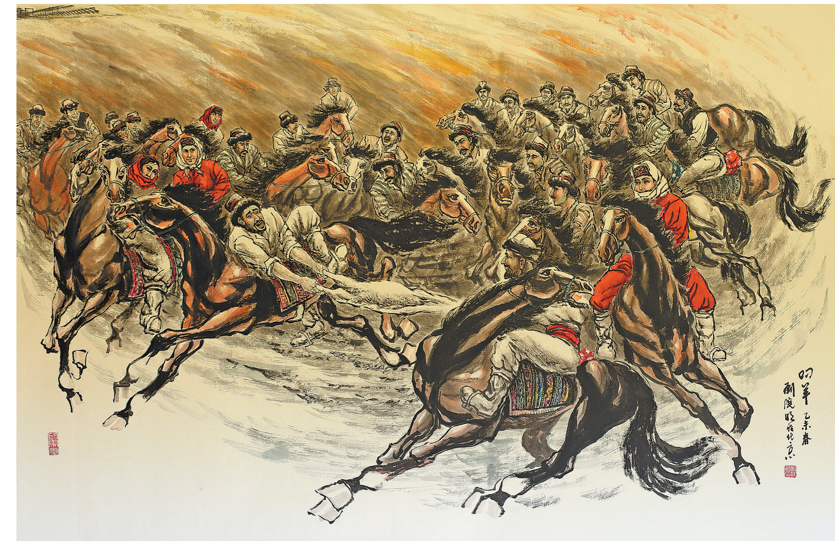
铺轨庆典——叼羊(国画)