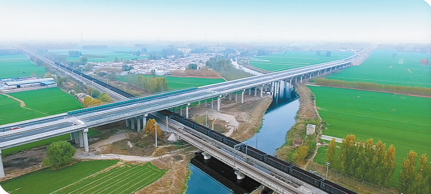
◀济宁经开区高架桥。