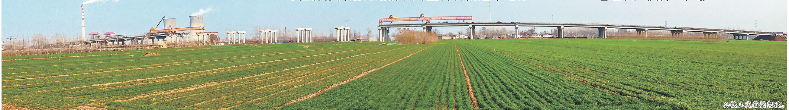
公路立交桥梁建设。