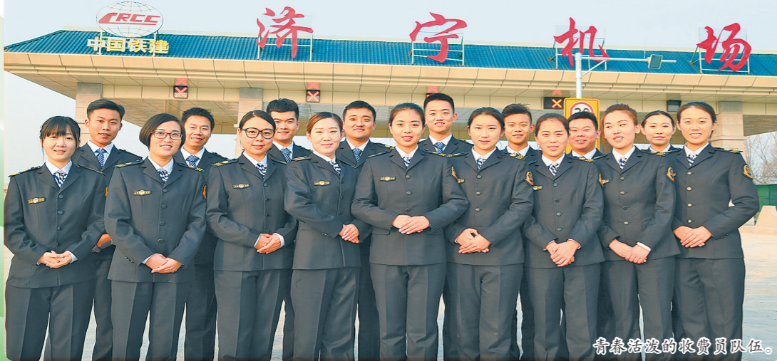
青春绽放的收费员队伍。

在济鱼高速公路良好示范效应的推动下,山东省对中国铁建的投资建设能力给予了充分肯定,中国铁建投资集团也在紧盯山东省内几条重点高速公路项目。戚喜章表示,“2016年是济鱼高速公路建设的收官之年,同时也是运营启动之年。济鱼公司将牢固树立质量、安全、廉洁、环保‘四个责任重于泰山’的思想,秉承‘诚信、创新永恒,精品、人品同在’的企业价值观,依托中国铁建品牌、人才、资金、社会资源等优势,积极投身山东基础设施建设领域,为中国铁建巩固和拓展山东市场贡献自己的力量。”