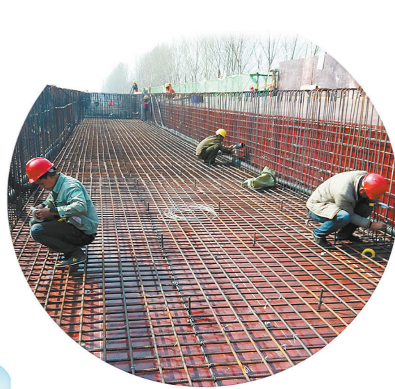
▲高架桥现浇梁施工。

设计速度120公里/小时。沿途设济宁、鱼台2个服务区,停车区1处,监控管理分中心1处、养护工区2处,设济宁经开区、济宁机场、济宁南、金乡东、鱼台西、鲁苏主线共6处收费站。济鱼高速穿越济宁市经济腹地,不仅结束了金乡、鱼台两县不通高速的历史,打通了“断头路”,而且完善了山东省高速公路路网结构,更成为联通鲁西经济带和淮海经济带的重要纽带。作为山东省西部地区南北省际大通道,它的建成对缓解京台高速交通压力、完善全省高速公路网结构、发挥路网整体效益、优化区域路网布局具有十分重要的意义。