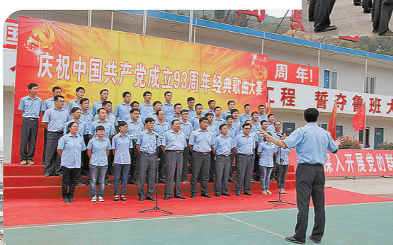
项目部举行庆祝中国共产党成立93周年经典歌曲大赛。