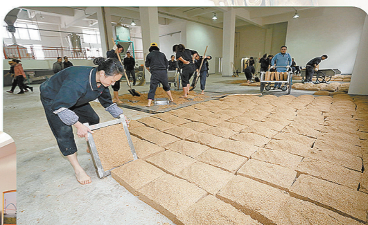
茅台酒扩建工程5号制曲车间交付使用后,茅台酒厂工人在新制曲车间内开始新一轮的制曲生产。