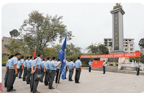
“七一”期间,项目部开展“继承先烈遗志,弘扬铁建精神,建功国酒茅台,圆梦祖国腾飞”主题教育活动。

茅台工程施工4年来,党旗始终高高飘扬在工地上空。项目部不仅保证了阶段性建设任务的圆满完成,缓解了茅台酒产能供求矛盾,而且以干促挽,在茅台酒厂新增了环山酒库、7号地块制曲厂房、老厂区道路升级改造、老厂区电力信号改造等市场份额,还承揽了南陶停车场、王子酒、大唐酒业等项目。如今,酒业工程已经成为中铁二十二局一张独特的金色名片。