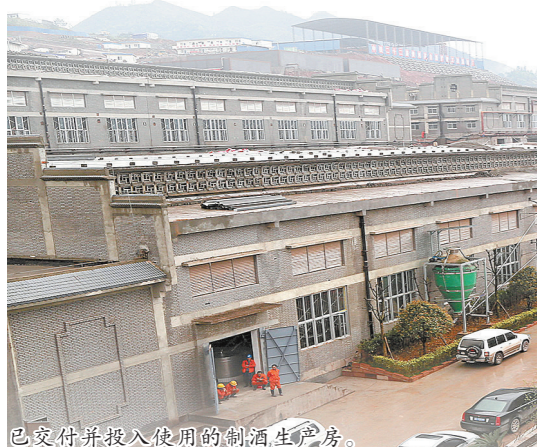
已交付并投入使用的制酒生产房。