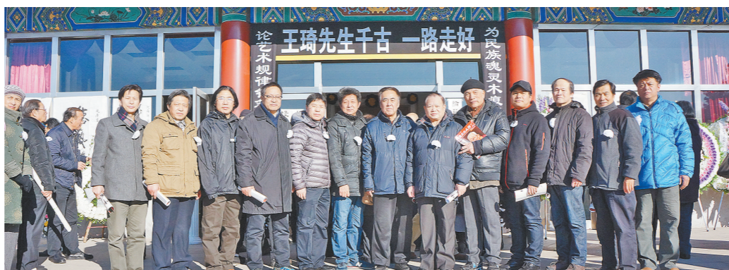
12月14日,大路画家在八宝山革命公墓参加“王琦先生追悼会”。