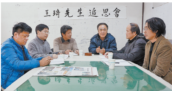
12月9日,大路美协在京大路画家召开“王琦先生追思会”。