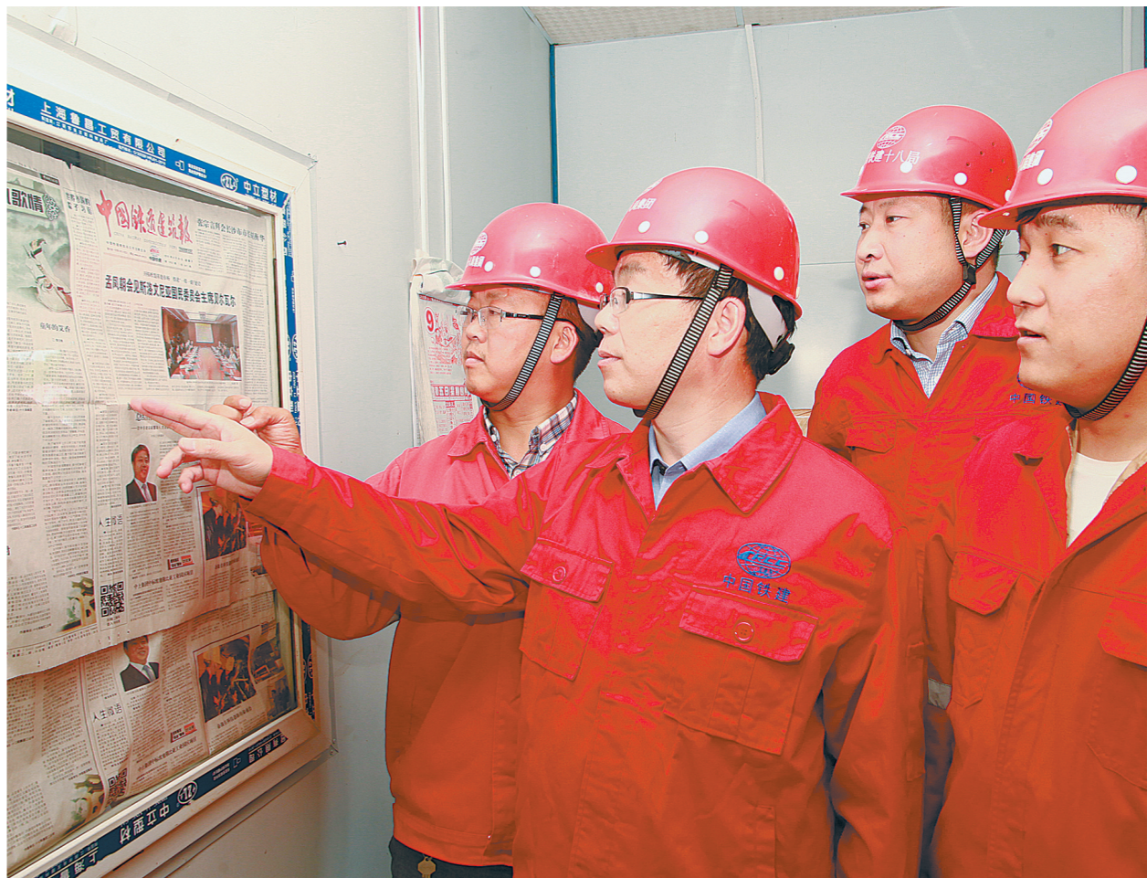
《中国铁道建筑报》弘扬主旋律,贴近职工生活,栏目新颖,设计精美,受到一线职工好评。多次获“江苏省安全文明工地”称号的中铁十八局四公司苏州地铁项目部,利用报纸开辟的特色专栏进行党建知识学习。图为该项目部党员干部在阅报栏阅读报纸。

“90后”的她,代表了一批“90后”铁建人的态度。怀着对工作的热爱、对企业的敬畏,尽管工作不居繁华闹市,每天风吹日晒奔波在工地,但她迎着崭新的太阳,面带微笑,努力工作,用心谱写了一曲歌唱生活和企业的赞歌,像一朵小青荷绽放在工地上,辛勤快乐地努力工作。她刚起步,需要太多的历练,写作是她的爱好,我们期待着她有更好更多的作品问世。