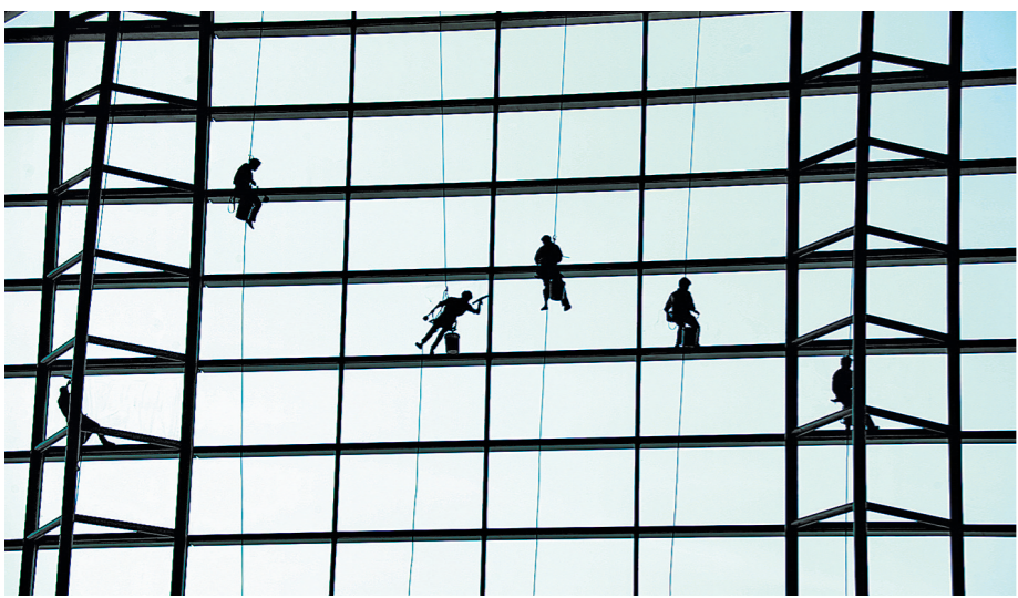
“五线谱”上的美容师

11月30日,习近平总书记出席中国文联十大、中国作协九大,在开幕式的讲话中指出,“广大文艺工作者要做真善美的追求者和传播者”,“坚守艺术理想,用高尚的文艺引领社会风尚”。这是强调文艺承担着树立文明标杆、推动社会进步的沉重责任。