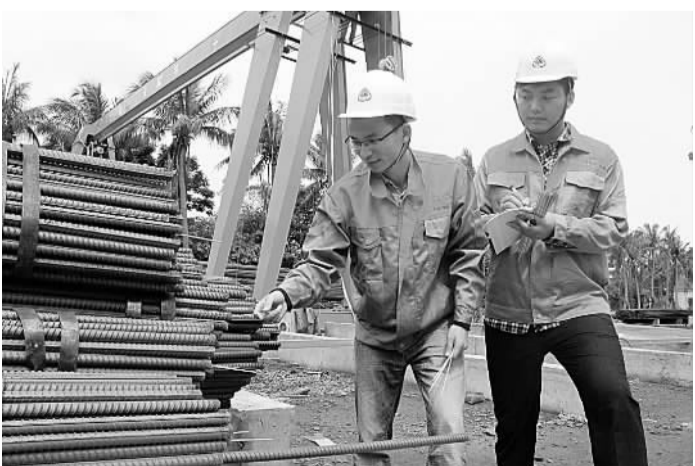
物资集团海南公司物流基地年货物吞吐量可达40万吨,是目前海南省唯一的中央企业钢材仓储物流基地。图为仓储人员在新建成的自有现代化仓储物流基地清点货物。

经过近4个月的紧张准备,于6月24日一次性通过对神龙一号及神龙二号盾构机及其后配套等全部进场设备的报验工作。期间,他们多次邀请有关专家对施工方案进行论证,同时对参与地铁盾构施工人员进行多次集中培训,确保盾构掘进期间周边建筑物及道路安全。