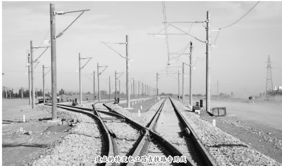
建成的特变电昌吉铁路专用线

35次铁路三级施工,没有一次顶点,全部安全按期开通。为解决好各类施工方案报审以及既有线路施工计划审批繁琐、耗时等问题,他们超前计划,主动出击,积极联系协调,确保各项施工计划任务如期完成。在铁路三级施工中,他们把安全放在首位来抓。一抓措施方案到位,