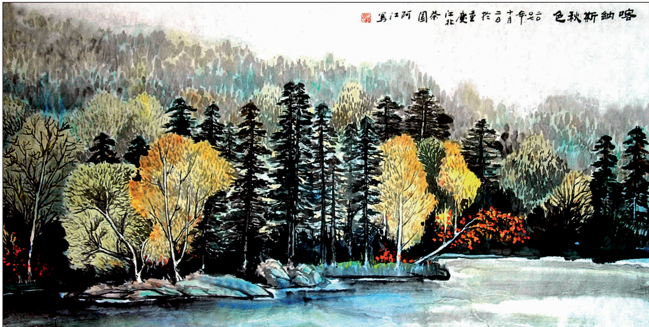
▲喀纳斯秋色 段绪江