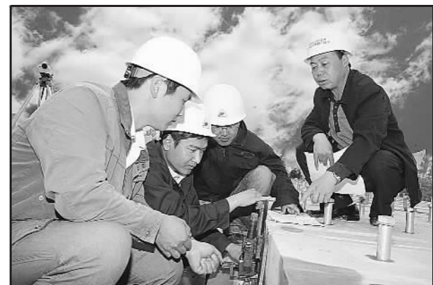
▲检查精调爪安装位置精确度