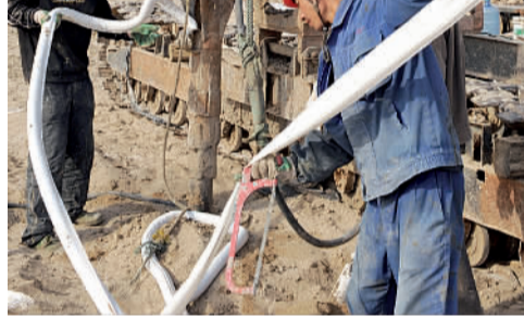
袋装砂井施工现场