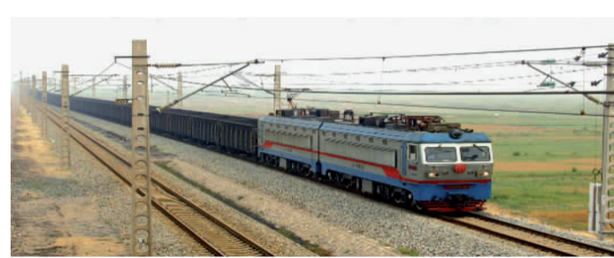
荣获中国土木工程詹天佑大奖的朔黄铁路肃宁至黄骅港段增建二线工程