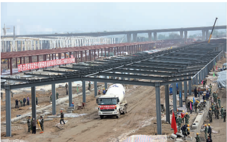
由二十一局集团承建的西宁北货运中心抗震救灾应急工程站台已具雏形