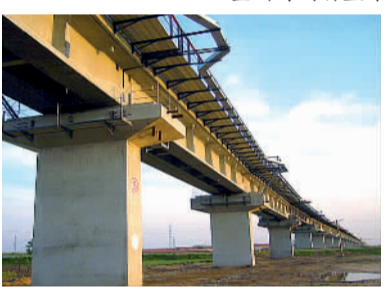
黄万铁路跨沧黄铁路特大桥