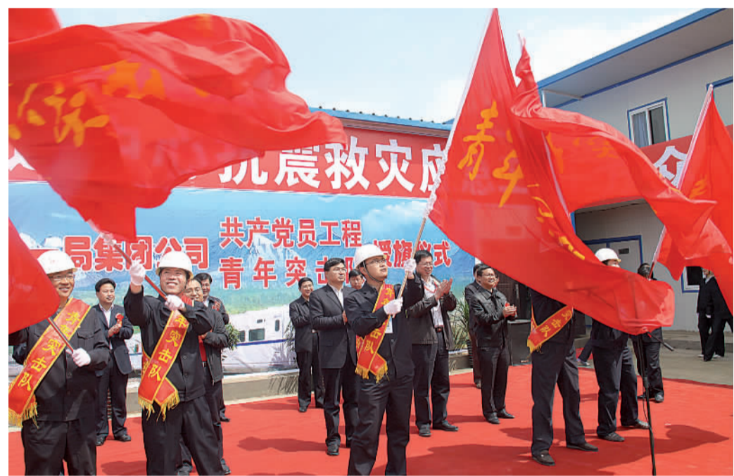
履行应急工程使命,再现突击队风采

共青团中央书记处第一书记看到这样的施工场面,感慨万千,要求参建突击队,发扬光荣传统,勇于挑战,用优异成绩为夺取灾后重建工作最后胜利作出当代青年应有的贡献。