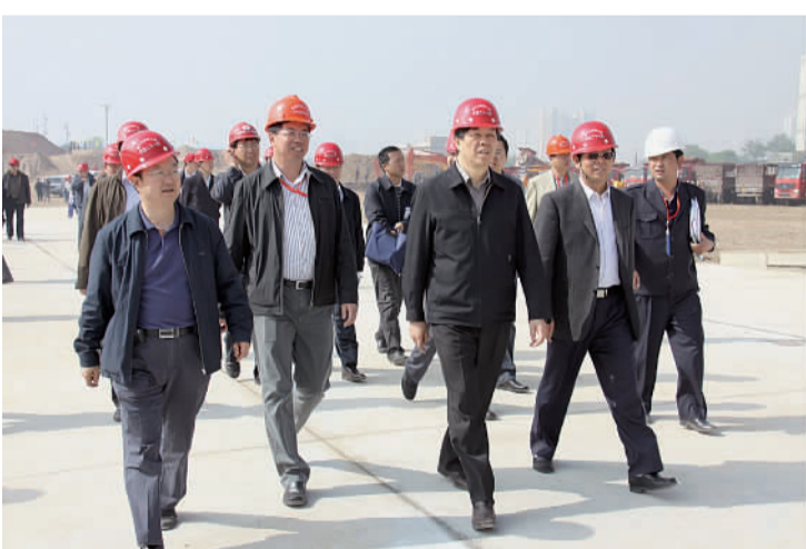
铁道部领导莅临西宁北检查指导工作