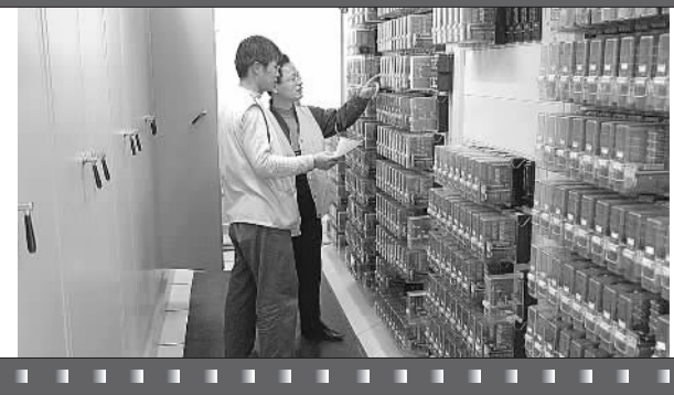
车站信号微机联锁室内作业。