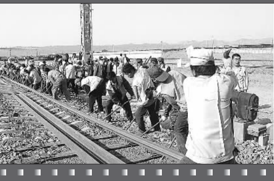
站改拨接道岔作业。