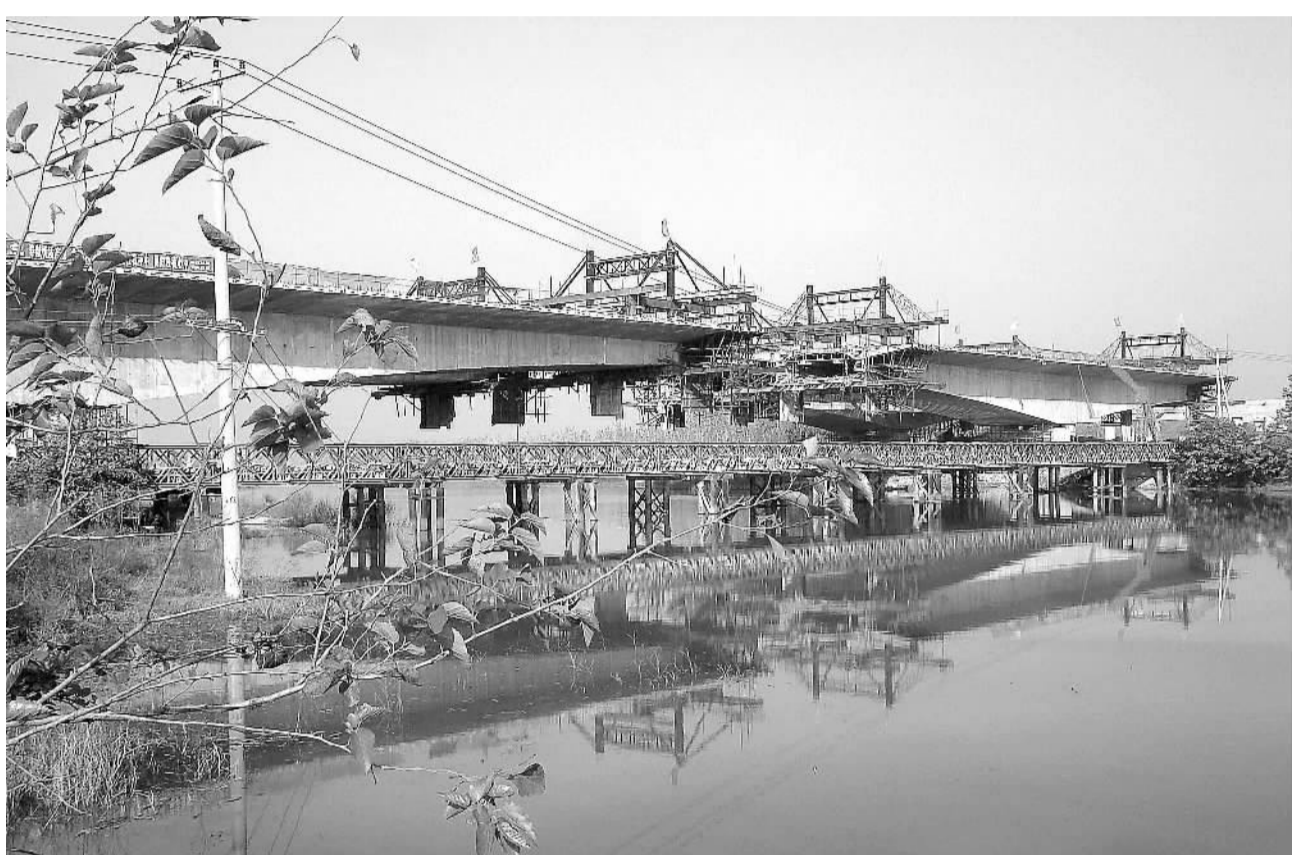
由二十四局集团安徽公司承建的合(肥)淮(南)阜(阳)高速公路21标段合肥三十里岗董铺水库大桥,为确保施工环保不污染,采用“挂篮式”生态环保施工法...